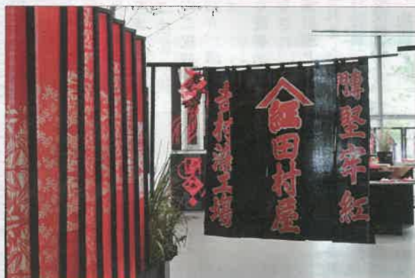
2016年10月28日(金)~11月2日(水) 高崎シティギャラリー第2展示室にて開催されました