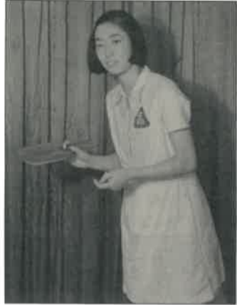
女学校5年生の時 賀野にある爆弾を

令和2年は新型コロナウイルス感染症に振り廻された1年でした。私達の環境も変わり、それぞれが自分の生活スタイルについて考