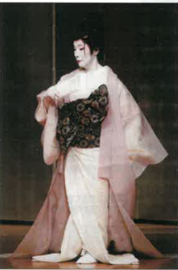
(母校学校医耳鼻科)

「人生の扉」の歌詞の一節です。70才を越してこれからの人生が10本の指で数えられるとふと感じた時はこの歌を思い出します。仕事への意欲と苦勞の中に楽しみを感じた年代があり、願いが叶った50才。私の定年は65才と思っていたのにまだ頑張れるかもしれないと思えるのです。とは言え酒量も減りやっばり歳ですね。6才から始めた日本舞踊は未だに続ける事が出来、60の手習いで始めた俳句と書は自分