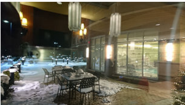
少し雪が積もっています