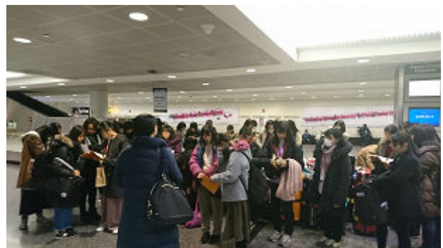
ここからバンに分乗してホテルへ