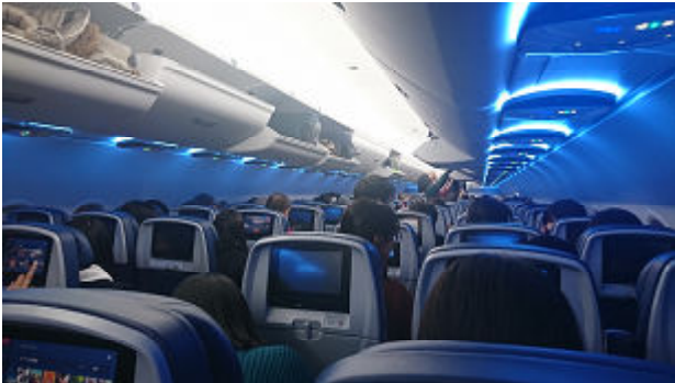
ミネアポリスからの飛行機は最新型！