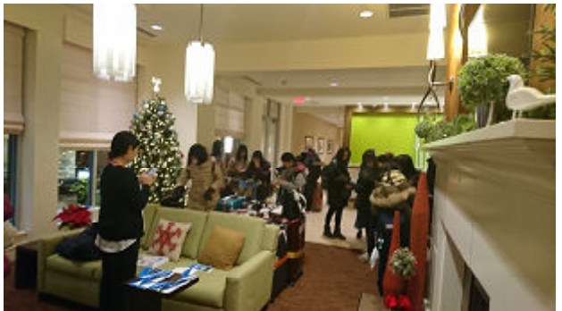
ホテルのロビーで鍵を受け取ります