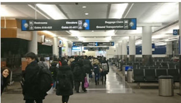
ボストン空港には、予定通り 21:20 に到着