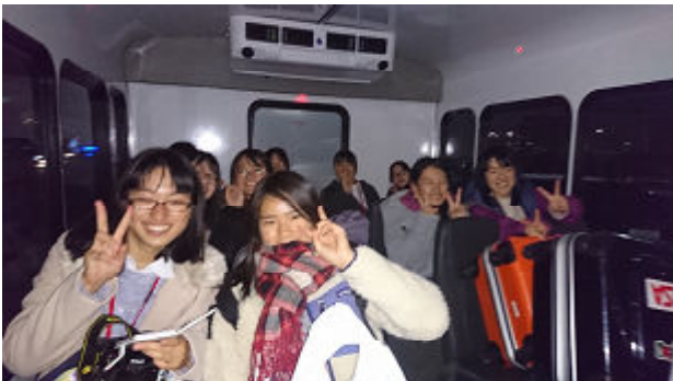
ホテルのバンの中（4台に分かれて移動）