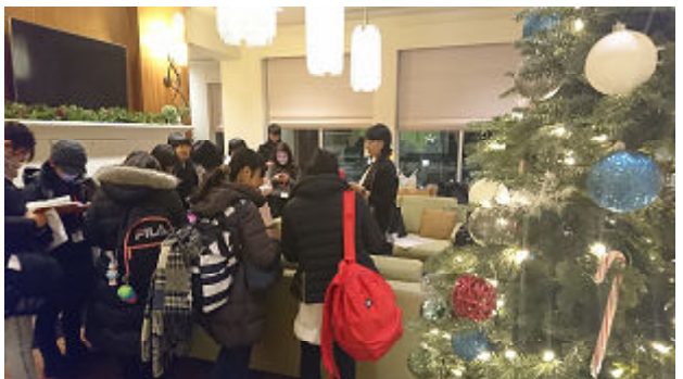
クリスマスの飾りもありました

長い、長い一日でしたが、予定通りに進みました。明日からも気合い入れていきますよ！