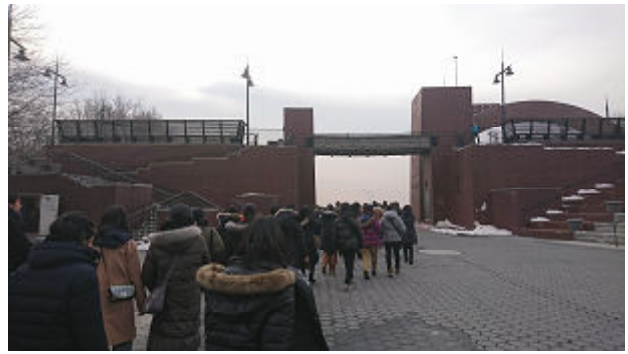
メトロポリタン美術館に行く途中、バッテリーパークから自由の女神を見学