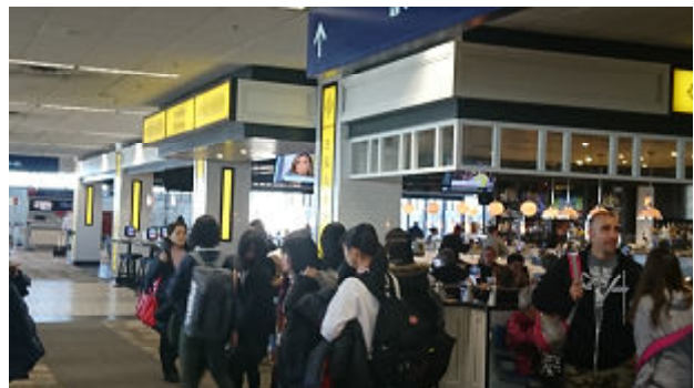
経由地のミネアポリス空港に着きました。少しの自由時間も、もう慣れたものです。