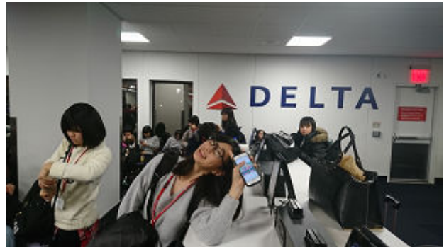
出国審査を通過して、搭乗までほっと一息。休む人もいれば、しりとりする人も。