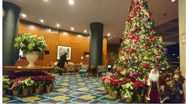
宿泊したワトソンホテルのカウンターロビーです。