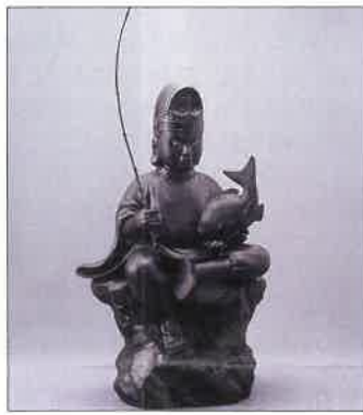
「輪王寺護摩堂 七福神 恵比寿」(画像は後塗りの状態です。現在は漆落され安直されおります)

歴史ある金谷ホテルの昼食では、鯛料理又はビーフシチューに舌鼓を打ちました。田母沢御用邸は丸窓から美しいお庭の景色を望める御学問所、剣聖の間など厳かで品位的な空間を堪能しました。素晴らしいおもてなしをして下さった89期の先輩方に心より感謝申し上げます。